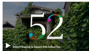
The 52 Places Traveler visits the Setouchi Islands, where a triennial art extravaganza is injecting creative energy into the fading fishing villages.