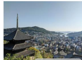
4. Se perdre dans les ruelles des hauteurs d'Onomichi