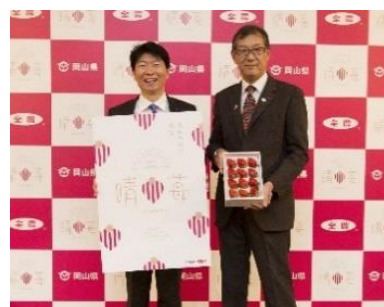
ブランドいちご「晴莓（はれいちご）」発表会

そして、昨年12月、このラインナップに新たに岡山県産高級いちご「晴莓（はれいちご）」が加わりました。まだ出荷量は少ないですが、色と形が美しく、濃厚な甘さとほのかな酸味が味わえるブランドいちごです。今後、「晴莓」を使ったパフェも登場する予定ですので、ぜひ岡山に来て、味わってみてください！！