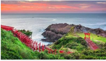
A view of the Millennium Inari Shrine