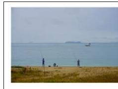
▲記事より抜粋(上蒲刈島)