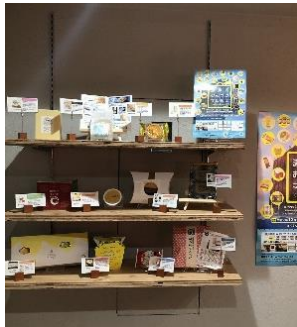
▲瀬戸内おみやげカフェ