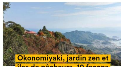
Okonomiyaki, jardin zen et îles de pêcheurs, 10 façons de découvrir le Japon autrement