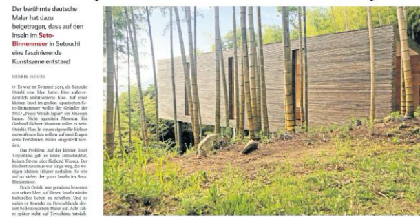
Der berühmte deutsche Maler hat dazu beigetragen, dass auf den Inseln im Seto-Binnenmeer in Setouchi eine faszinierende Kunstszene entstand