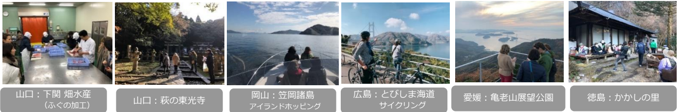
山口：下関 燻水産 (ふぐの加工)