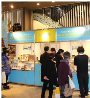
▲瀬戸内おみやげマルシェ 瀬戸内おみやげコンクール（広島会場）