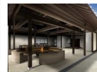
▲ござこ森 土間リビング