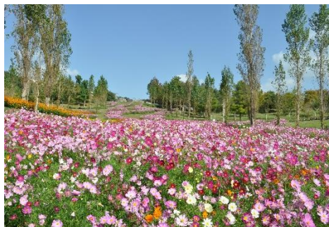
国営明石海峡公園のコスモス

淡路花博「ジャパンフローラ2000」から20年を迎える今年、「淡路花博 20周年記念 花みどりフェア」が開催されます。