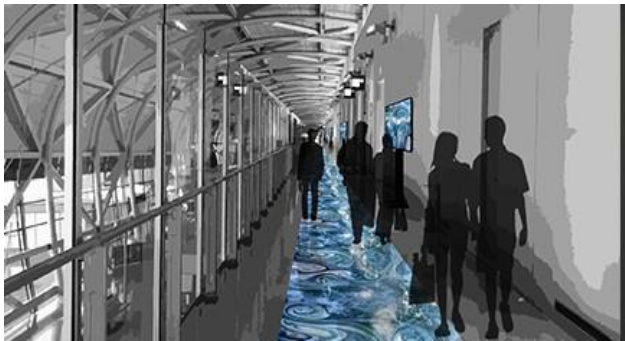
▼展示イメージ（国際線北到着導線）