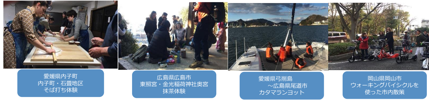
愛媛県内子町 内子町・石畳地区 そば打ち体験

今回の視察ツアーに対して、外国人旅行者目線でのコメントを多数いただき、これを基に地域の更なる魅力的な旅行商品作りにつなげていく予定です。今後も引き続き、フランス市場に対して効果的なプロモーション活動を行ってまいります