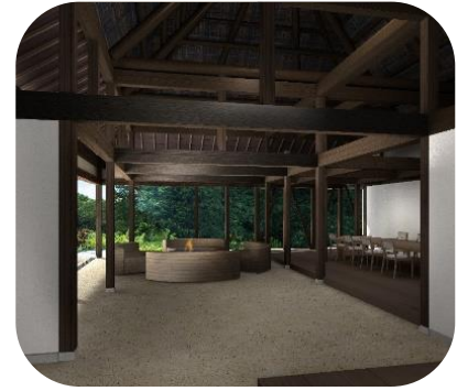
せとうち古民家ステイズHiroshima『こごこ森』イメージパース

せとうち古民家ステイズは、瀬戸内域内に点在する歴史的価値を持つ古民家の魅力を活かして、快適に過ごせるように現代的にリノベーションを施し活用するプロジェクトです。これまで、愛媛県内子町のせとうち古民家ステイズ内子の宿『織』及び『久』と合わせ、5棟の古民家が一棟貸しのバケーションレンタル施設として生まれ変わり、様々なお客様の瀬戸内での旅にご利用頂いております。