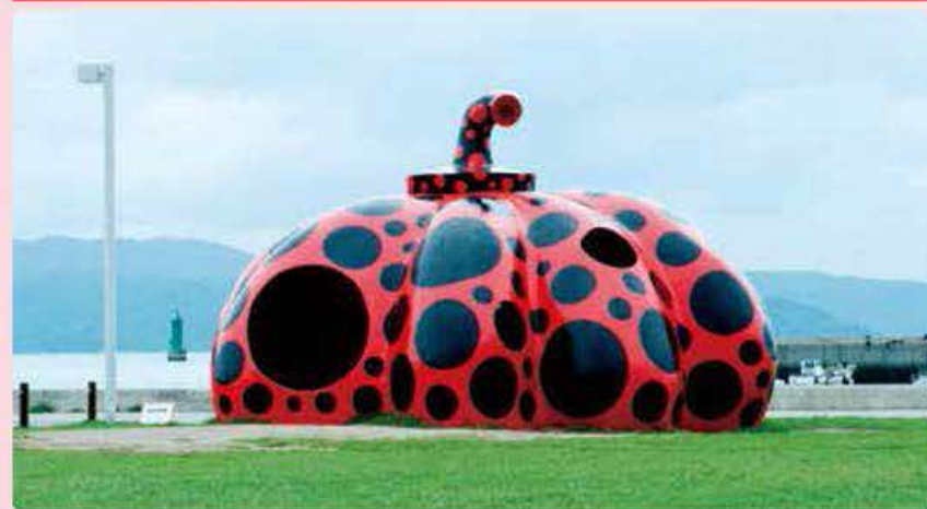
"Red Pumpkin" ©Yayoi Kusama, 2006 Naoshima Miyaura Port Square