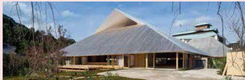
Naoshima Hall Owner: Naoshima Town Architect: Sambuichi Architects