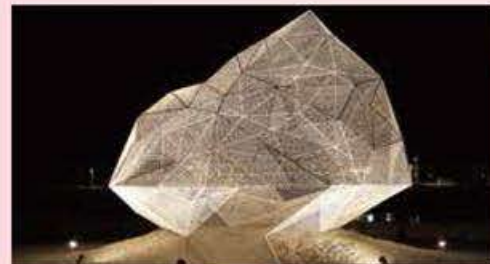
Naoshima Pavillon Owner: Naoshima Town Architect: Sou Fujimoto Architects