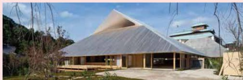
Naoshima Hall Owner: Naoshima Town Architect: Sambuichi Architects