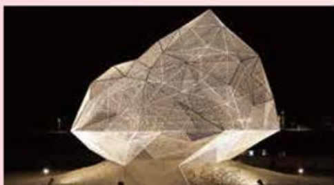
Naoshima Pavilion Owner: Naoshima Town Architect: Sou Fujimoto Architects