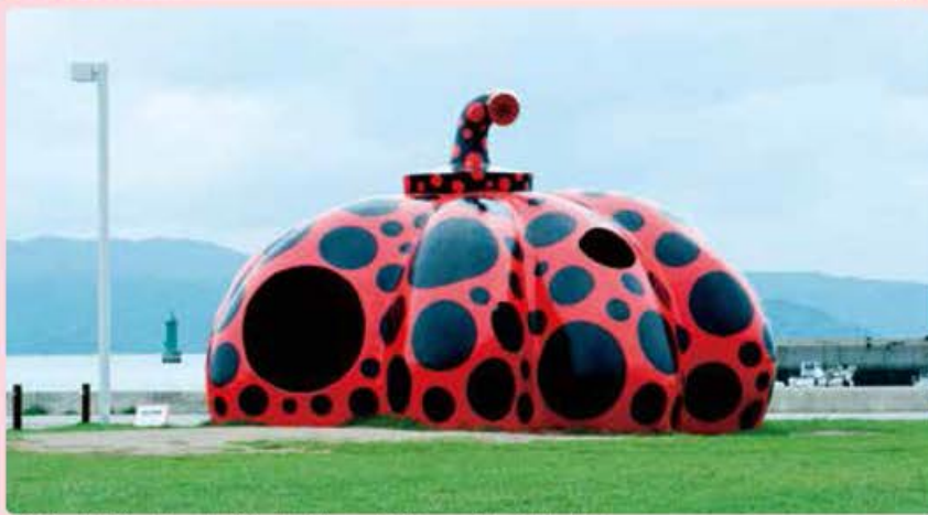
"Red Pumpkin" ©Yayoi Kusama, 2006 Naoshima Miyaura Port Square