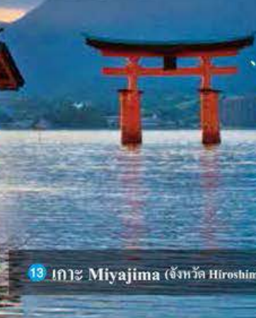
13 เกาะ Miyajima (จังหวัด Hiroshima)