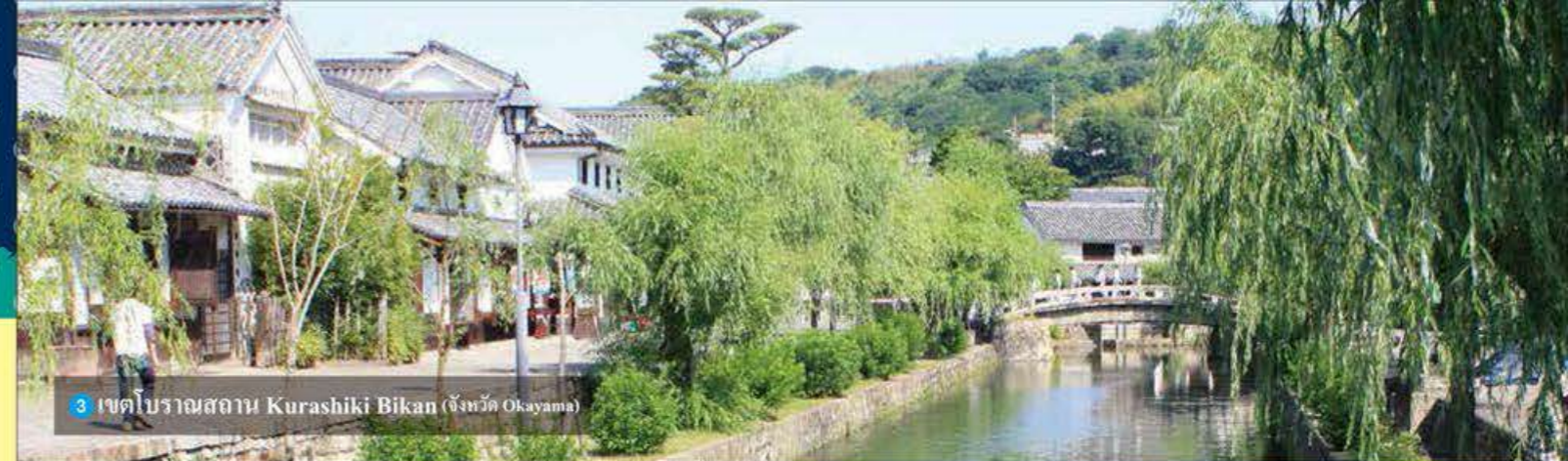
3 เขตโบราณสถาน Kurashiki Bikan (จังหวัด Okayama)