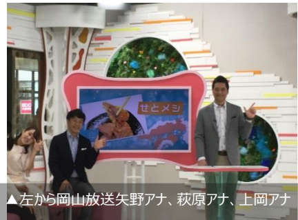
▲左から岡山放送矢野アナ、萩原アナ、上岡アナ