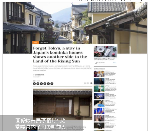
画像は古民家宿「久」と 愛媛県内子町の町並み