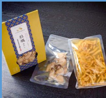
炊き込みご飯の素 (牡蠣釜めしの素)