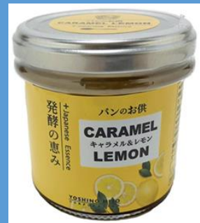
パンのお供 キャラメル&レモン