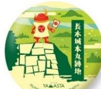
【デジタルスタンプ】