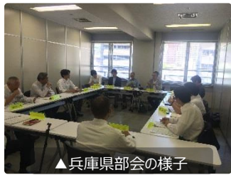
▲兵庫県部会の様子