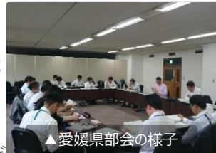
▲愛媛県部会の様子

せとうち観光推進機構は観光客の受入環境充実に取り組む「エリアマネジメントチーム」を設置し、各県市町村と連携を図っています。5～6月にかけて各拠点地区の対応状況や課題を話し合う部会を各地で開催しました。機構から部会の役割や機構の全体戦略、本年度の事業計画の説明、昨年度に実施した調査事業の報告等を行いました。各県・各地区の担当者からは「市の受入環境の実態が把握できていない」、「機構の昨年度事業の外国人動態分析には非常に関心がある。外国人観光客の人数や導線などが分かれば効果的な施策を打てる。」といった課題やご意見が挙げられ、今後の施策についても話し合いました。