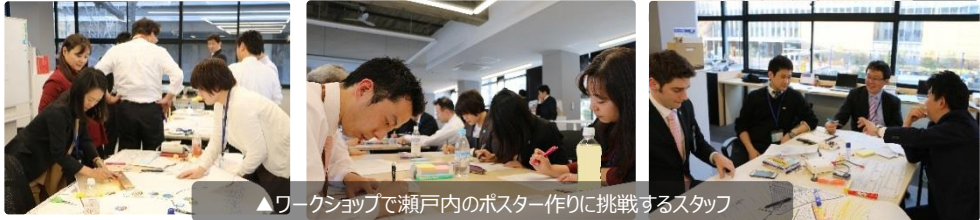
▲ワークショップで瀬戸内のポスター作りに挑戦するスタッフ