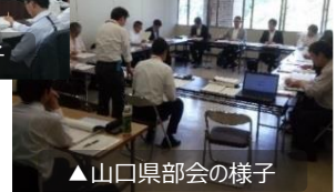
▲山口県部会の様子