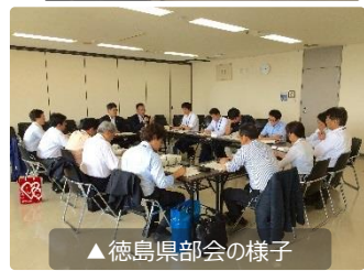
▲徳島県部会の様子