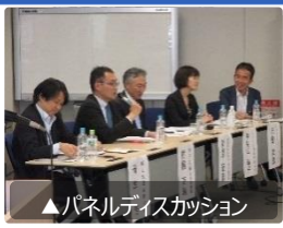
▲パネルディスカッション