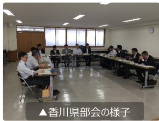
▲香川県部会の様子