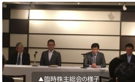
▲臨時株主総会の様子