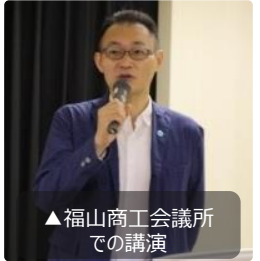
▲福山商工会議所 での講演