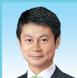
湯崎 英彦 [広島県知事]