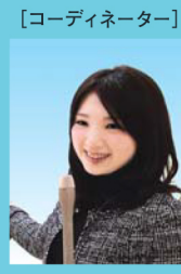
[コーディネーター]