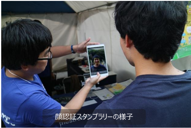
顔認証スタンプラリーの様子

せとうちDMOの参画企業であるNECは、四国吉野川中流域におけるラフティング世界選手権2017の開催(10月3日～9日まで徳島県三好市で開催)にあわせてスタンプラリーサービスと観光アプリを提供し、訪れる選手や観戦客に向けた大会情報や観光情報の発信と周辺観光地への周遊促進のためのイベントを、三好市の産業観光部と連携して実施しました。「かおdeスタンプラリー」は、スタンプラリー実施場所でタブ