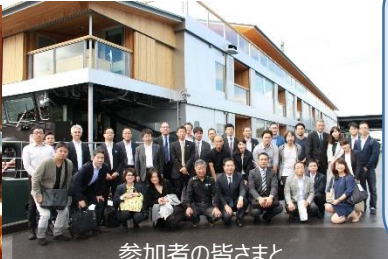
参加者の皆さまと ガンツウの前で記念撮影

ガンツウでは、瀬戸内の魅力を思う存分味わってもらえるよう、地元の工芸品や食材を使っています。地元の皆さまにのびのびと応援してもらいたいです。(城代表取締役)