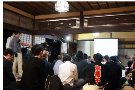
▲ワークショップの様子

当日はNHKの取材も入り、熱く意見を交し合う様子や参加者のインタビューを撮影。中国エリアのNHK各局にて12月8日に放送される予定です。 次回の津山デザインミーティングは、11月24日(金)開催予定です！