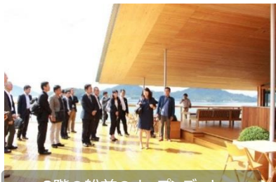
3階の船首のオープンデッキ