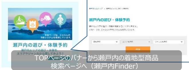
TOPページのバナーから瀬戸内の着地型商品検索ページへ (瀬戸内Finder)