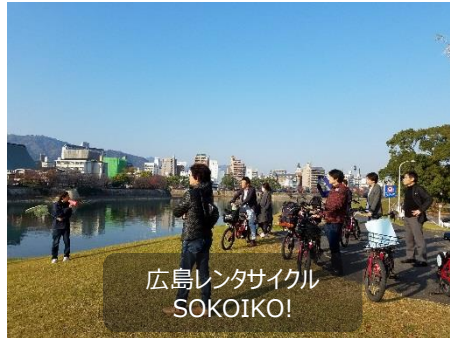
広島レンタサイクル SOKOIKO!