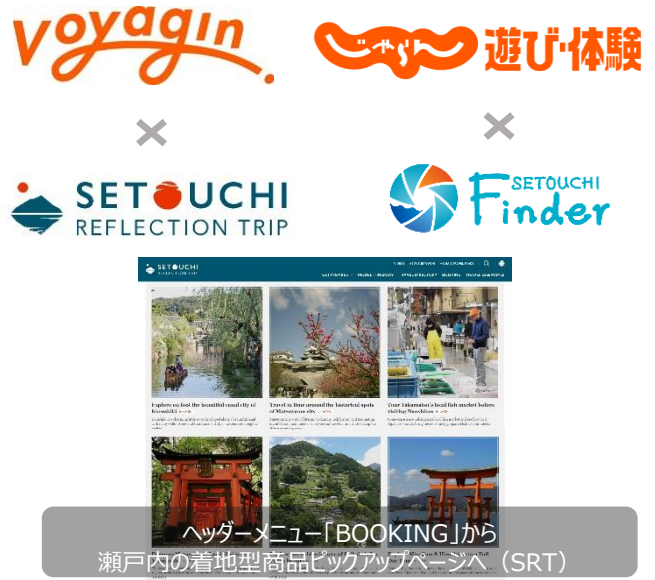
瀬戸内の着地型商品ピックアップページへ (SRT)