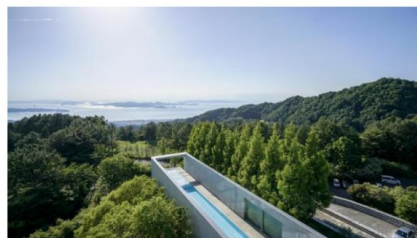
The top pool at Setouchi Retreat Aonagi

THE TIMES LUXURY TRAVEL Island-hopping in Japan: chic hotels, art and cycle trails