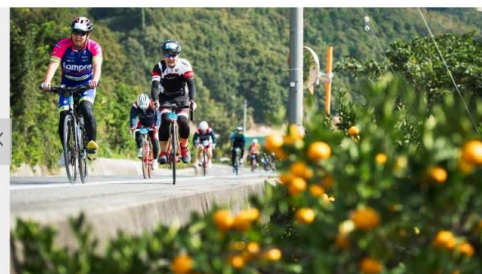
2/26 SLIDES