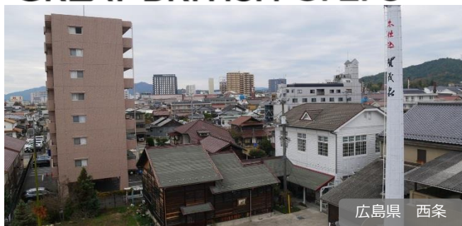
What to eat and drink in Hiroshima, Japan