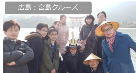
広島：宮島クルーズ