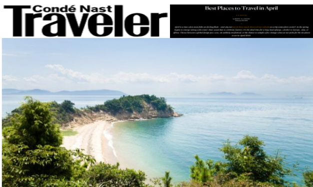
SETOUCHI, JAPAN 香川県 直島

< Best Places to Travel in April > 4月おすすめの旅先