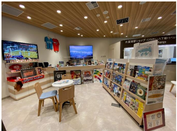
開放感あふれる案内所です！

みなさんこんにちは！最近とっても暑いですね。さて今日は、広島県内にある観光案内所「Setouchi Information Center@ HIROSHIMA BANK（通称：SIC）」をご紹介します♪ SICは、広島に来られた観光客の皆様へ、瀬戸内7県（兵庫県、岡山県、広島県、山口県、徳島県、香川県、愛媛県）の観光案内及び観光情報を発信を行っております。現在は、広島県内のお客様が多いですが、ソーシャルディスタンスをとりつつ、業務にあたっております。