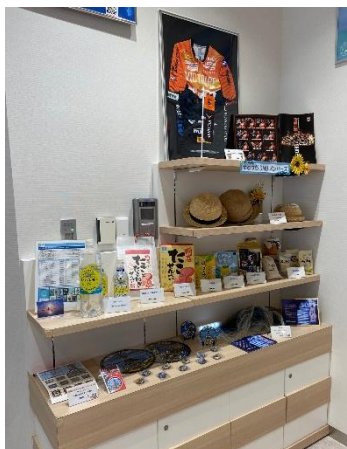
瀬戸内の商品がズラリ