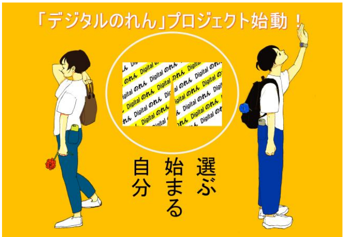
「デジタルのれん」プロジェクトのイメージイラスト