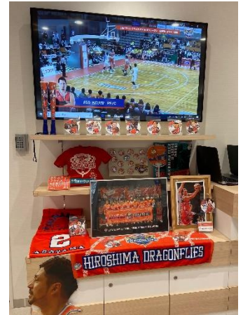
広島ドラゴンフライズコーナー