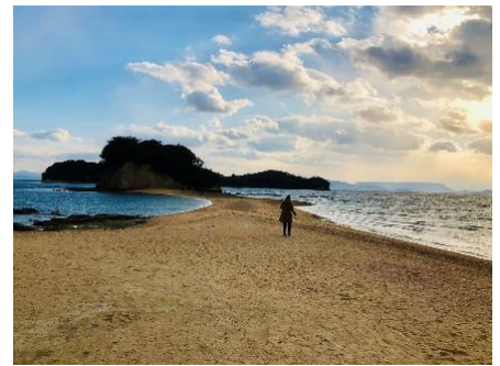
香川：エンジェルロード