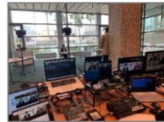
第7回瀬戸内ミーティングfrom 徳島の様子