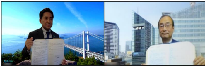
オンラインで執り行われた締結式の様子

両社は新型コロナウイルス感染症による難局に当たった地域活性に取り組み、観光地や観光関連事業者と共に活動してまいります。