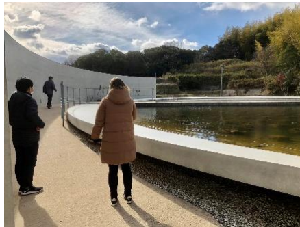
兵庫：本福寺 水御堂