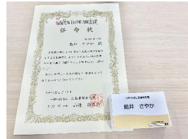
<HIT ひろしま観光大使募集中です！>