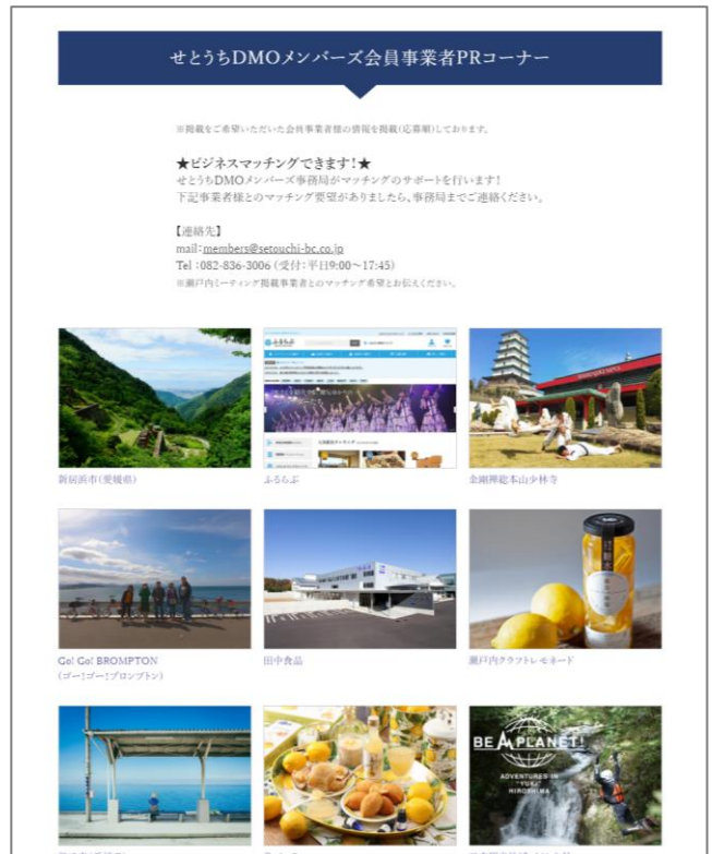
<瀬戸内ミーティングサイト上の会員事業者PRコーナー>

瀬戸内ミーティングを契機に、ビジネス拡大につながるというのはとても嬉しいことです！