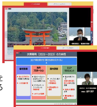
<ライブ配信の様子(ウェブサイト)>

大きなトラブルもなく、またすでに瀬戸内ミーティングを通じたビジネスマッチングが生まれており、大成功で終わることができました!