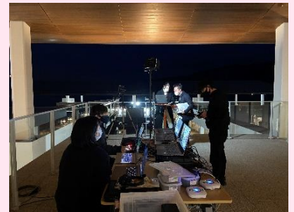
準備は夜までかかりました