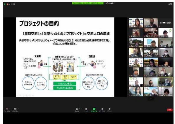
広島グループ・座談会の様子

せとうちDMOは今後もKDDI様の活動に協力し、地域が活性化するお手伝いをしてまいります。