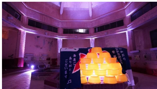
<スペシャルライトアップ点灯式・内覧会の様子>