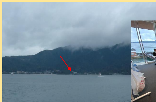
ライブ配信会場からは 改装中の大鳥居が見えました！