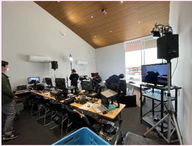
前日の準備の様子 機材の量半端ないって！

当日は、関係者の検温や消毒の徹底、講演者はフェイスガードを付けるなど、コロナ対策を徹底しながらスタッフ一丸となって対応しました。ご参加いただいた皆様、ありがとうございました！