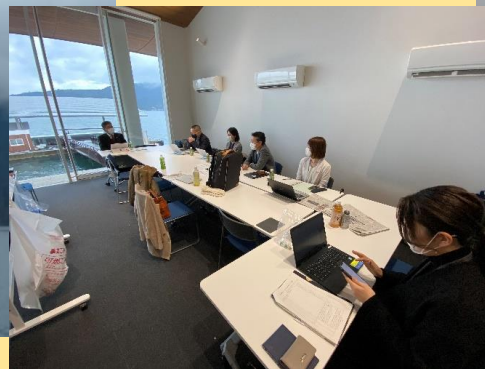
当日の控室の様子。 広島観光団体の幹部が集まる場で少し緊張（撮影者が）