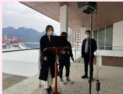
機材を念入りにチェック