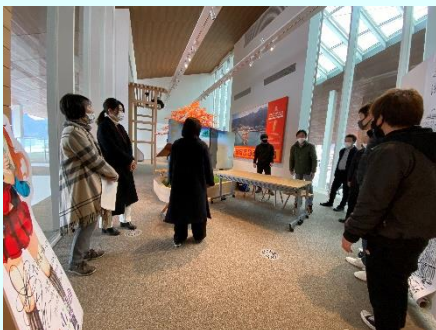
念入りにミーティング