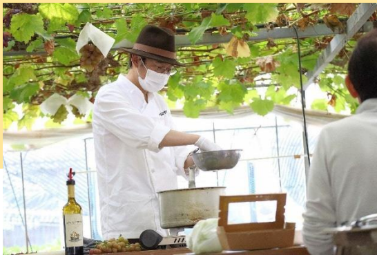
ツウになるフルーツ探訪