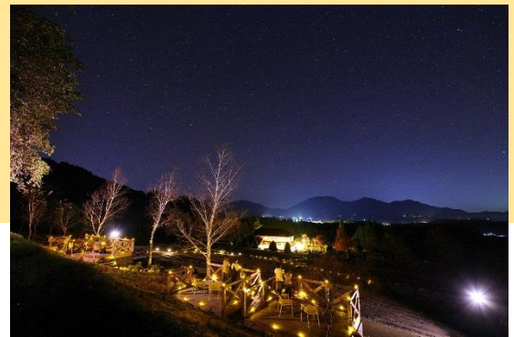
蒜山スターウォッチング