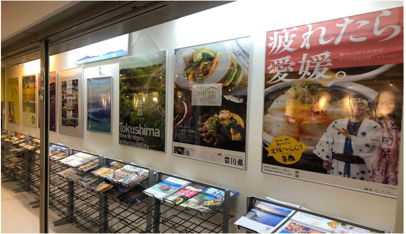
※せとうちインフォメーションコーナーの様子

せとうちDMOは、2021年4月9日より神戸市・三宮センタープラザ東館B1において「せとうちインフォメーションコーナー」を開設、瀬戸内7県の観光ポスターの掲示やパンフレット・チラシを設置しています。