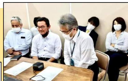
▲当日の様子(そらの郷)