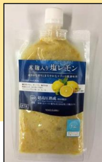
米麴入り塩レモン (株式会社東洋サブリ)