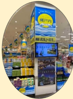
当日は瀬戸内各県からご協力いただき、観光ポスター、チラシを設置し、オリジナル動画を放映