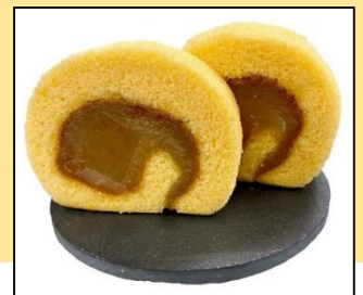
紅まどんなのタルト (亀井製菓株式会社)