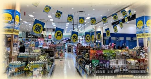
～イオンスタイル広島府中店にて～ 瀬戸内ブランドであふれています。