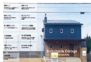
<サスティナブルコテージ>