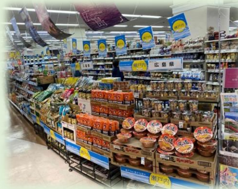
↑ ～イオンスタイル綾川店(香川)にて～ ポスター、チラシ、瀬戸内ブランドの商品がバランスよく配置されています。