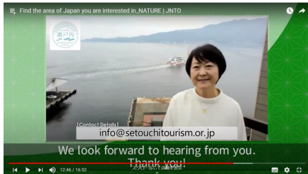
＜せとうちDMOを紹介する動画＞

まだまだ観光業界にとっても厳しい時期が続きますが、今後もあらゆる機会をとらえて瀬戸内を元気に盛り上げていく取り組みを続けていきたいと考えています。