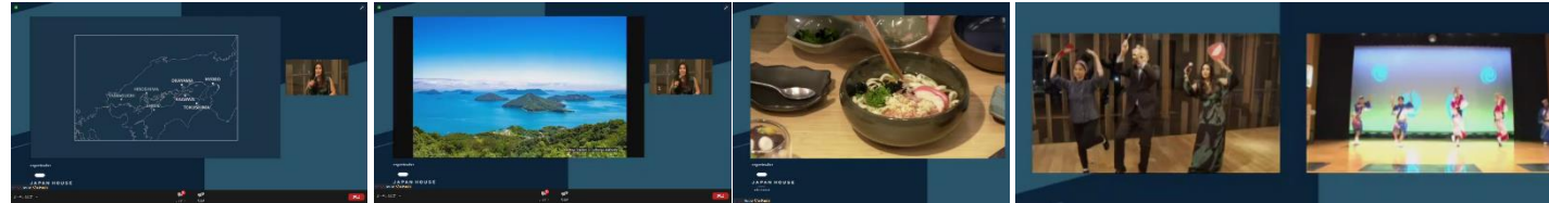
▲当日のイベントの様子：イベントには一般のブラジル人に加えインフルエンサー等が参加しました。

ジャパン・ハウスは、日本の多様な魅力や政策・取組の発信を通じ、これまで必ずしも日本に関心がなかった人々を含む幅広い層をひきつけ、親日派・知日派の裾野を一層拡大することを目的に、サンパウロ（ブラジル）、ロンドン（英国）及びロサンゼルス（米国）に設置されています。2017年4月に開館したジャパン・ハウス サンパウロは、一般の方々及び学術・文化機関、民間企業、コミュニティとの連携・協力・交流を生み出す対外発信拠点であり、日本のアート、工芸、ビジネス、スポーツ、デザイン、ファッション、ガストロノミー、観光、科学やテクノロジーなど幅広い分野で、施設やデジタルメディアを使った展示、セミナー、ワークショップなどを展開しています。2020年2月には累計来館者数200万人を突破。パウリスタ通りの主要な施設として定着しています。