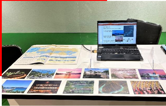
＜瀬戸内をPRするパンフレット等＞

コロナ禍の影響で当初見込んでいた来場者数とはいきませんでした。国内外メディアとのつながりが持つ貴重な機会と捉え、また今後のアフターコロナの観光業復活期に向け、現状で実施可能な瀬戸内の情報発信ができたのではないかと思います。