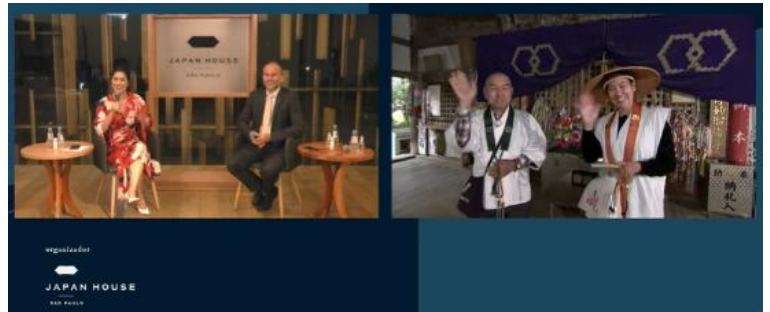
▲当日のイベントの様子：西瀬戸内の説明。山口の日本酒の説明。Azumi Setoda、浄瑠璃寺から中継。