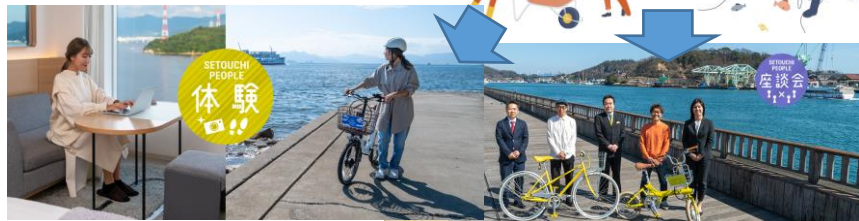
瀬戸内の魅力を様々な切り口でご紹介