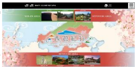
海外向けプロジェクト特設サイト

瀬戸内を広くに周遊いただくツールの一つである「瀬戸内エリアパス」は、鉄道だけでなく、瀬戸内の周遊に便利な船の移動も組込まれている等、中四国地域を広く周遊いただけるよう事業者の皆様と連携して設定しています。