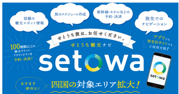
アプリでお得な乗り放題チケットや観光素材、情報等を提供