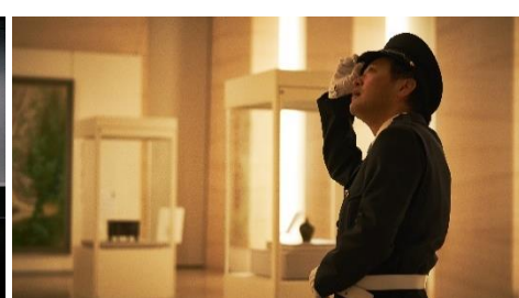
第3弾 広島県立美術館 ひろしまナイトミュージアム in 広島県立美術館 https://www.xperisus.com/hiroshima-prefectural-art-night-museum2022