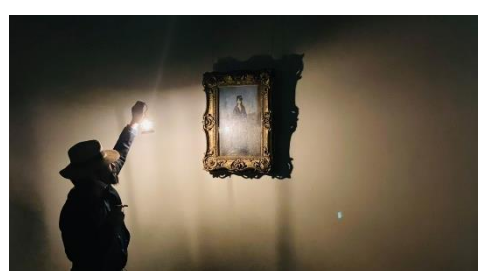
第1弾 ひろしま美術館 ひろしまナイトミュージアム～印象派版～ https://www.xperisus.com/hiroshimanightmuseum-1p