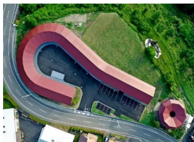
ゼロ・ウェイストセンター