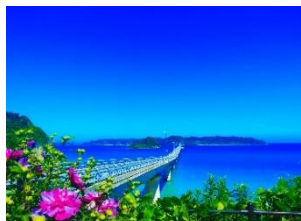
ドラマやCMにも起用された角島大橋 (下関市)

山口県では、市町や関係事業者と連携して、新たなニーズを着実に捉え、山口県ならではの魅力的な観光コンテンツの造成や安心して県内観光を楽しめる受入環境の充実を図り、インバウンドの拡大に取り組んでいきます。