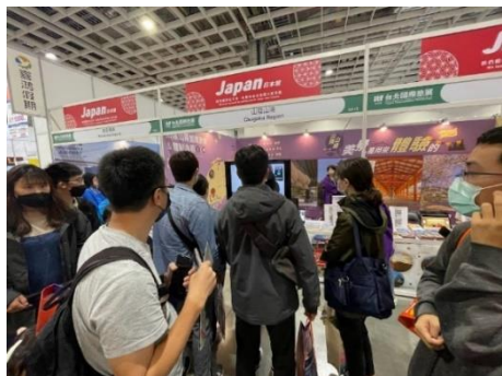
昨年11月に台湾で実施したプロモーションの様子

岡山には日本三名園の一つである「岡山後楽園」や、白壁の町並みが美しい「倉敷美観地区」、西日本屈指の高原リゾート地「蒜山高原」や美作三湯を中心とする温泉地などに加え、特産のフルーツやご当地グルメ、海の幸といった食の魅力にもあふれています。こうした魅力を余すことなくPRし、インバウンド誘致に積極的に取り組んでまいります。