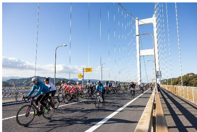
サイクリングしまなみ2022開催の様子

今後もサイクリングや道後温泉、豊かな自然や歴史をフックに、インバウンドの復活・誘客促進に向け、コンテンツのブラッシュアップや環境整備に取り組んでいきます。