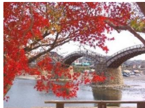
四季折々の景色が楽しめる錦帯橋 (岩国市)