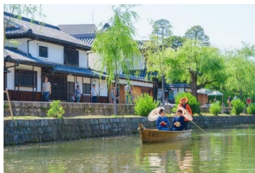
台湾でも大人気だった倉敷美観地区の川船流しの様子