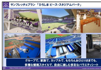
グループで、家族で、カップルで、もちろんおひとりさまでも、多様な観戦スタイルで、自由に楽しむ多彩なバラエティシート