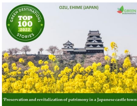
「世界の持続可能な観光地」TOP100に 選ばれた大洲市の大洲城