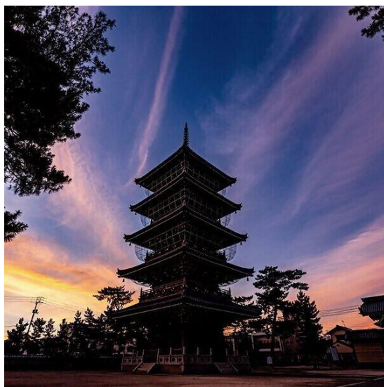
弘法大師空海生誕の地とされる 総本山善通寺

弘法大師空海の御誕生をお祝いするとともに、1250年祭を通して、多くの方の心に残る記念の年となることを目指していますので、是非この機会に香川県へお越しください。