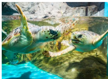
うみがめ博物館カレッタ