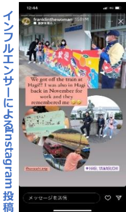
インフルエンサーにもInstagram投稿

地元住民の方々の場面でのおもてなし、「和」をコンセプトにした車内デザインを熱心に取材していただいた姿が印象的でした