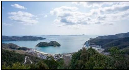
【瀬戸内の絶景 坂越浦城・茶白山城】