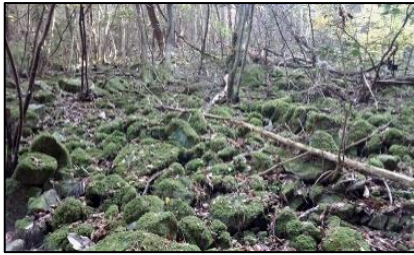
【落ちない城 白旗城】