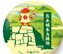
【デジタルスタンプ】