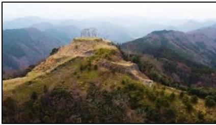
【雲を突く天空の城 利神城】