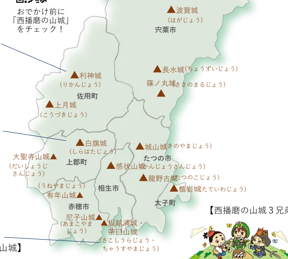
【西播磨の山城3兄弟】