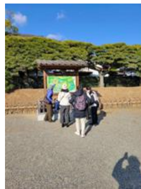
▲栗林公園での研修風景