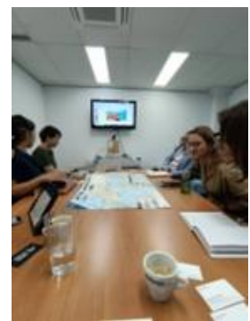
▲編集長等を集めコンテンツ等を紹介