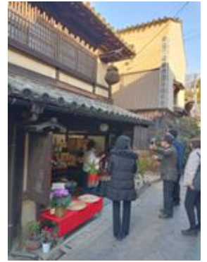
▲鞆の浦での研修風景

せとうち地域において、質の高いガイド案内をより多くご提供をいただけるように、今後も引き続き、各県の取組みやニーズも踏まえながら、ガイド機会の創出等お役に立っていければと思います。