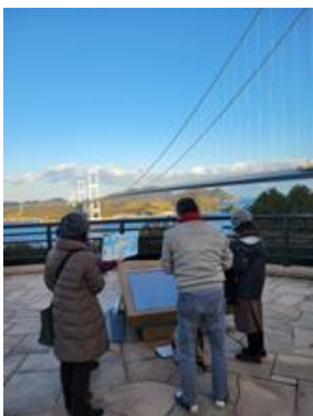
▲来島海峡大橋での研修風景