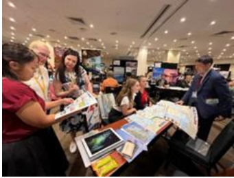
▲せとうちブースは複数の旅行会社に同時対応するほど人気