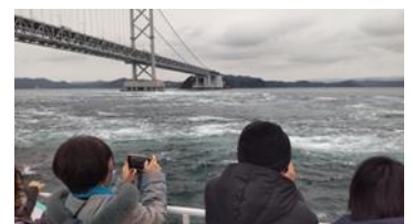
▼鳴門観潮船での研修風景