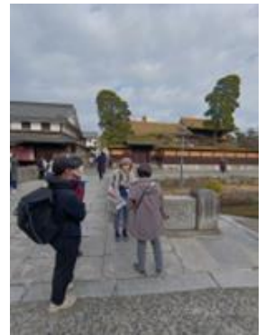
▲倉敷美観地区での研修風景