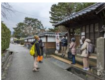
▼萩城下町での研修風景