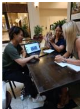
▲カフェミーティングも複数実施