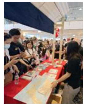
▲各ブースには旅程相談等の長い行列が