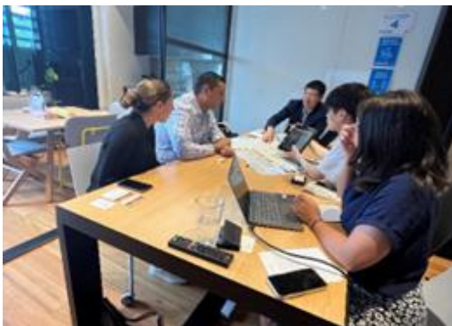
▲メディアへのセールスコールの様子