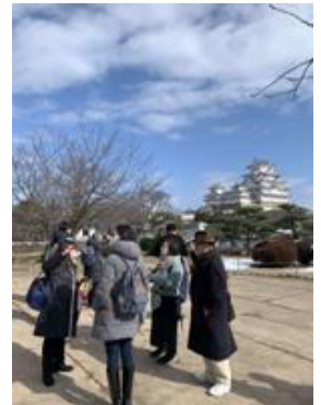
▲姫路城での研修風景