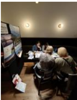
▲メルボルンでもひっきりなしに商談