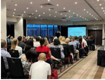
▲Japan Roadshow冒頭でJNTOによる参加者等紹介

これから、訪日インバウンドが回復していく上で、非常に日本への関心度が高いオーストラリア市場の可能性、瀬戸内地域を旅行先として選択肢にのぼらせ、実際に広く巡ってもらう上でさらなる認知向上の取組みの大切さを改めて実感した出張となりました。