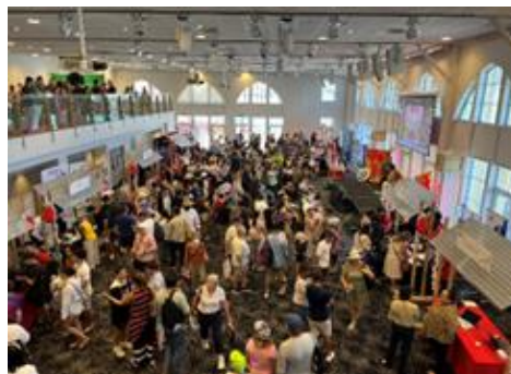
▲シドニーであったBtoCイベントの様子