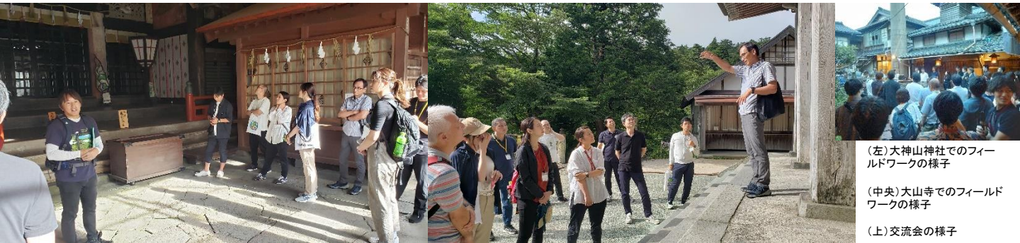
(左)大神山神社でのフィールドワークの様子

また、夜は交流会が催され、地元の美味しい食事に舌鼓を打ちながら、参加者の方々と情報交換をしました。