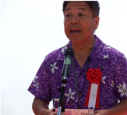
スピーチをされる藤本周防大島町長

セレモニーでは、オープニングスピーチとして山口県県議会議長の柳居俊様、周防大島町町長の藤本浄孝様からご祝辞を頂き、式典の特別ゲストとして、オレンジレイ様より、フラダンスの披露などがあり、セレモニーのハイライトを飾りました。