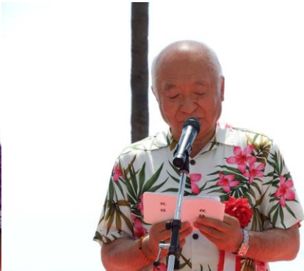
スピーチをされる柳居県議会議長