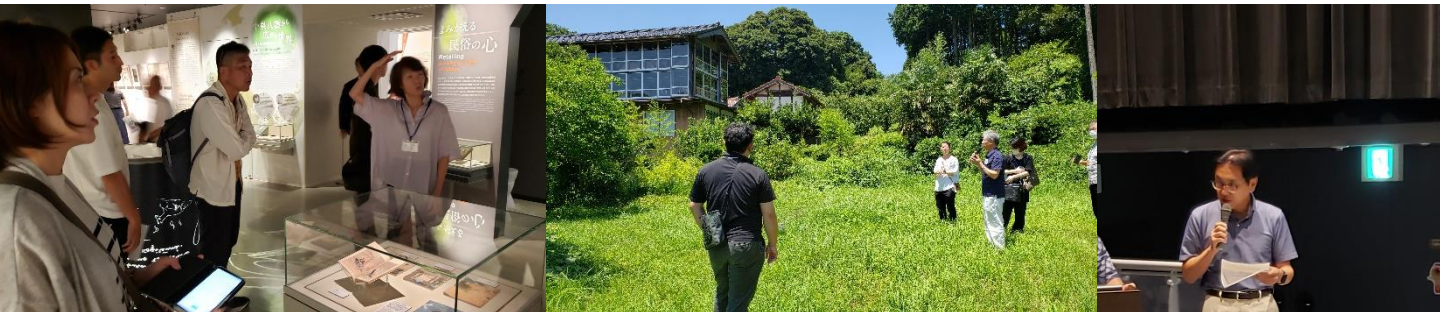
(左)小泉八雲記念館を視察した様子