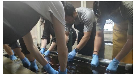
▲藍染めの体験風景(徳島)