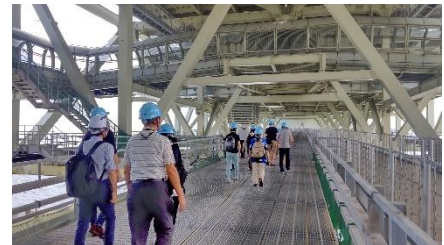
▲明石海峡大橋登頂体験の風景(兵庫)