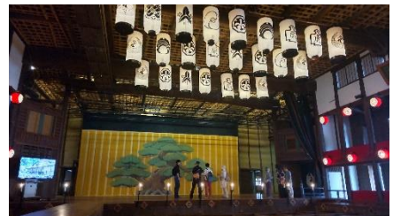
▲金丸座でのガイディング研修(香川)