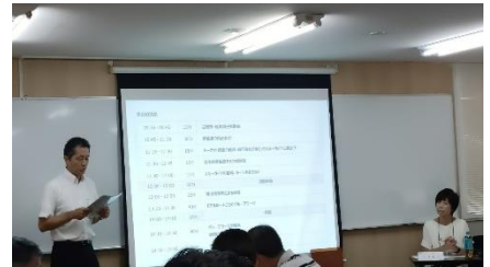
▲座学研修(広島会場)