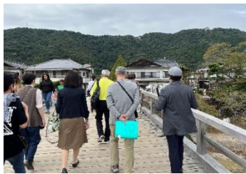
▲錦帯橋における研修風景(山口)