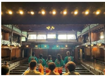
▲内子座における研修風景(愛媛)