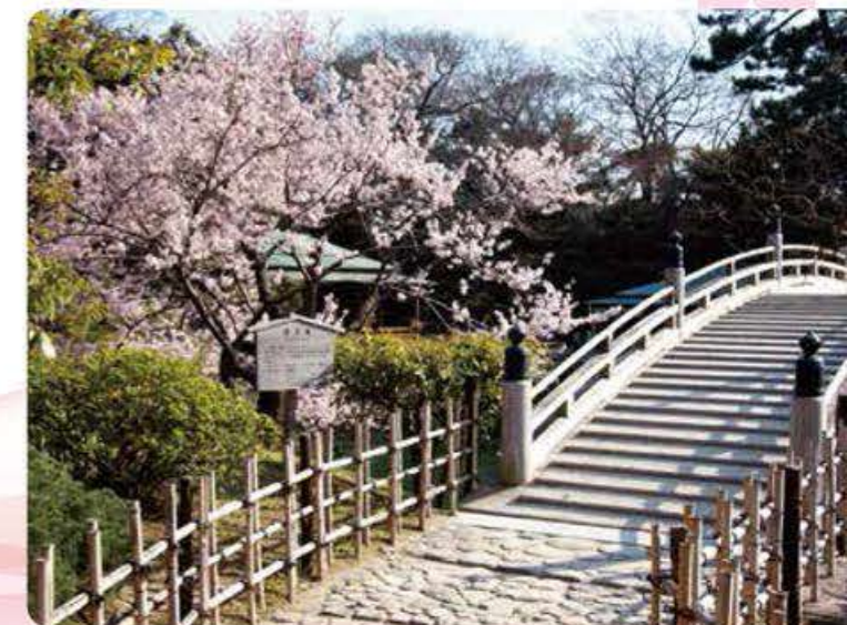
9 Jardin de Ritsurin [Ville de Takamatsu, Kagawa] >> P.31

La vue des cerisiers en fleurs avec le paysage du Jardin de Ritsurin en toile de fond est époustouflante. Et le reflet des cerisiers en fleurs sur la surface de la mare, combiné avec le paysage unique du parc, crée un spectacle à couper le souffle.