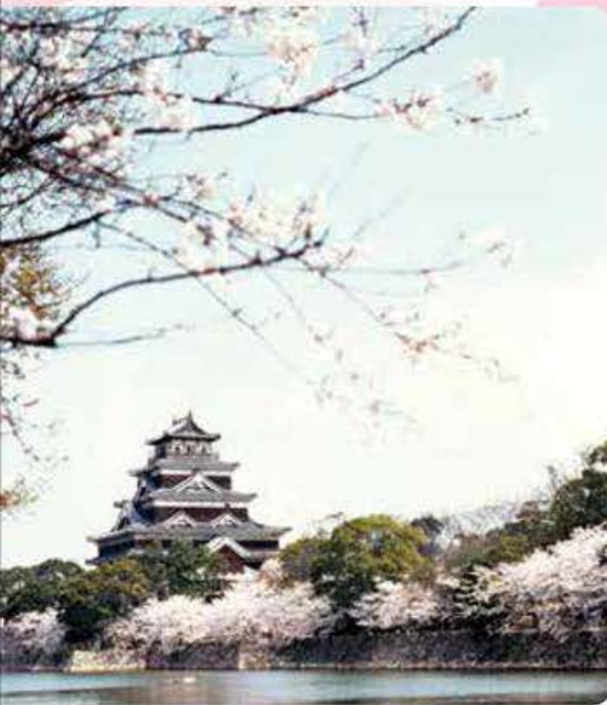
2 Château de Hiroshima [Ville de Hiroshima, Hiroshima]

Les douces nuances roses des nombreux cerisiers du Château de Himeji combinées aux murs blancs de la bâtisse créent un tableau qui attire de nombreux visiteurs chaque année.