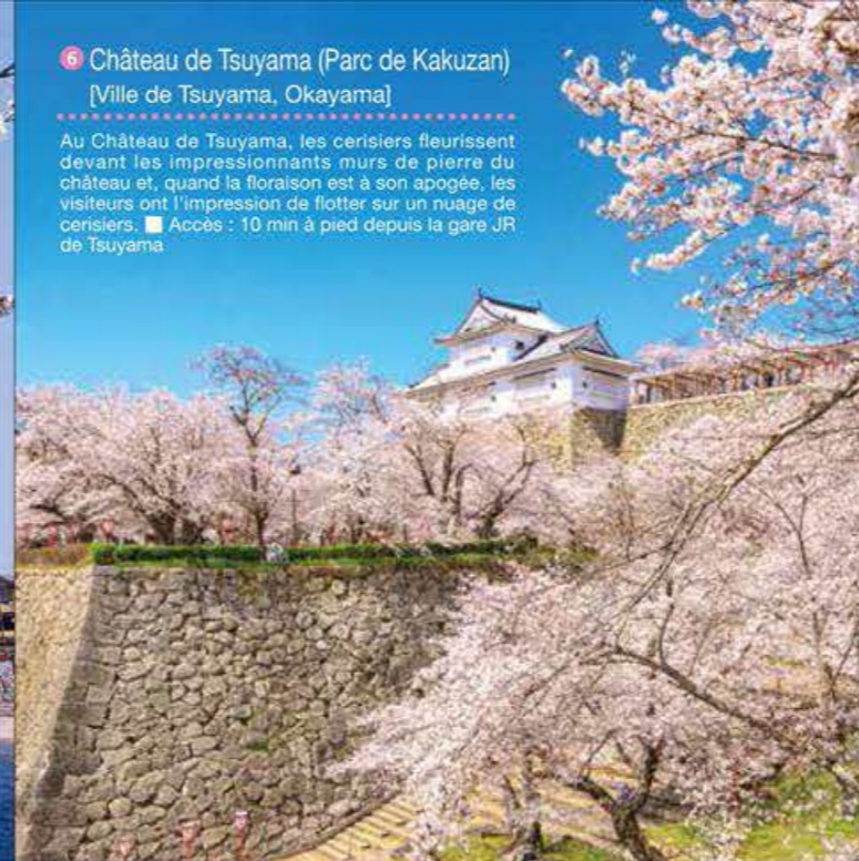
6 Château de Tsuyama (Parc de Kakuzan) [Ville de Tsuyama, Okayama]

La combinaison cerisiers en fleurs et beauté pittoresque du Pont de Kintai-kyo crée une vue magnifique. À la tombée de la nuit, la couleur dorée du Pont de Kintai-kyo est illuminée, créant ainsi un paysage mystique.