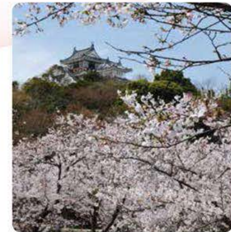
11 Mont Myoken [Ville de Naruto, Tokushima]

À l'arrivée du printemps, les cerisiers dressés au sommet du Mont Bizan se mettent à fleurir. La couleur des cerisiers en fleur se fond dans le paysage naturel pour créer une scène magnifique qui s'étend dans toute la montagne. ■ Accès : 10 minutes à pied depuis la gare JR de Tokushima jusqu'à Awa Odori Hall (5F, funiculaire de Bizan, station Sanroku), puis 6 minutes jusqu'au sommet du Mont Bizan