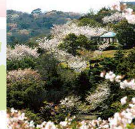
10 Mont Bizan [Ville de Tokushima, Tokushima]

À l'arrivée du printemps, les cerisiers dressés au sommet du Mont Bizan se mettent à fleurir. La couleur des cerisiers en fleur se fond dans le paysage naturel pour créer une scène magnifique qui s'étend dans toute la montagne. ■ Accès : 10 minutes à pied depuis la gare JR de Tokushima jusqu'à Awa Odori Hall (5F, funiculaire de Bizan, station Sanroku), puis 6 minutes jusqu'au sommet du Mont Bizan