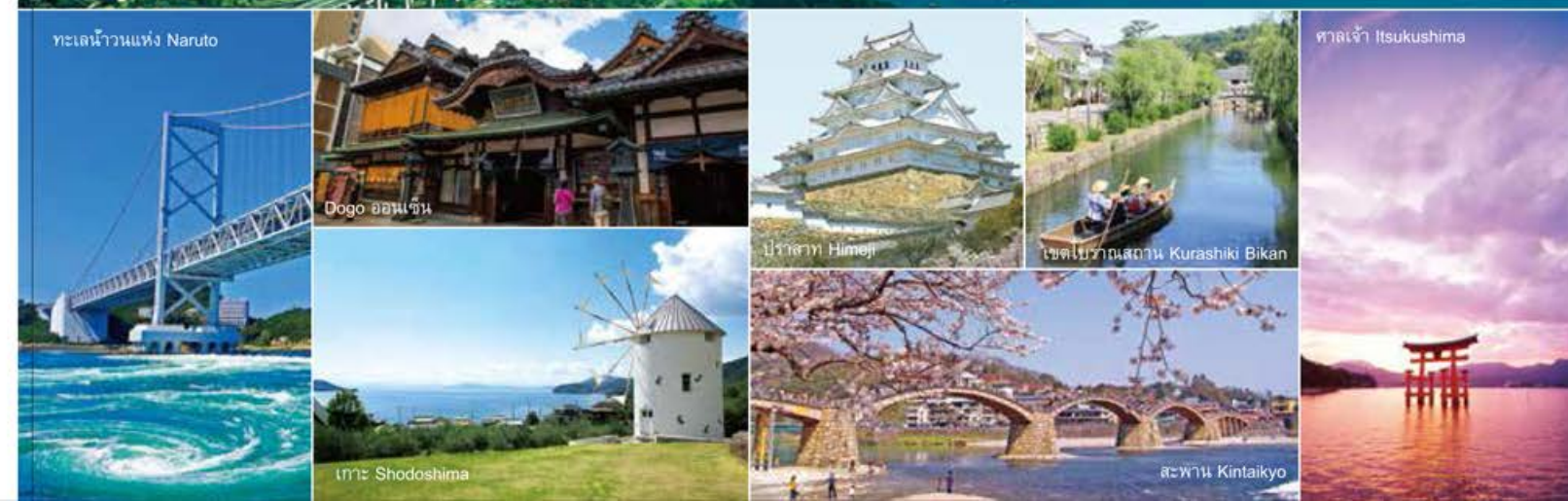
ทะเลน้ำวนแห่ง Naruto