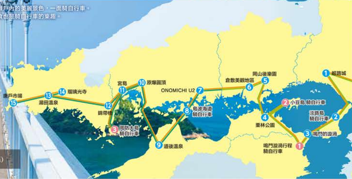
8 島波海道 (廣島縣~愛媛縣)

溫暖的陽光和清爽的風。不妨一面眺望窗外的美麗景色，一面騎自行車。能夠順道前往周圍的景點，或者享用美食也是騎自行車的樂趣。