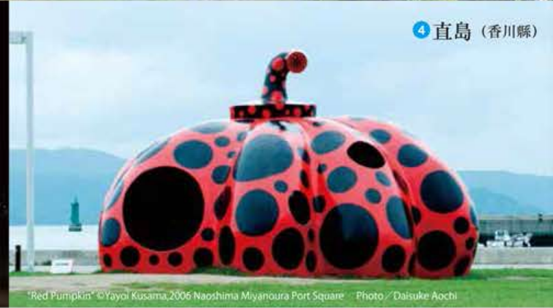
4 直島 (香川縣)