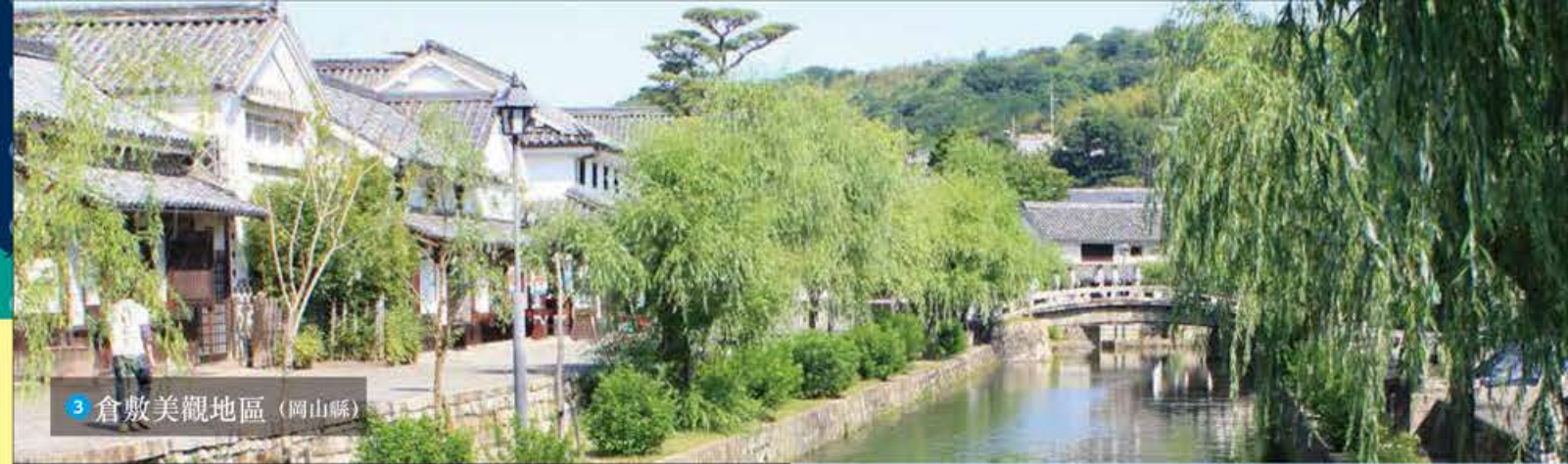
3 倉敷美觀地區 (岡山縣)