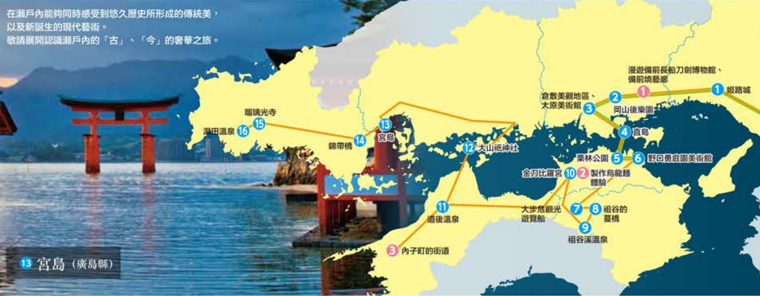
13 宮島 (廣島縣)

在瀨戶內能夠同時感受到悠久歷史所形成的傳統美，以及新誕生的現代藝術。敬請展開認識瀨戶內的「古」、「今」的奢華之旅。